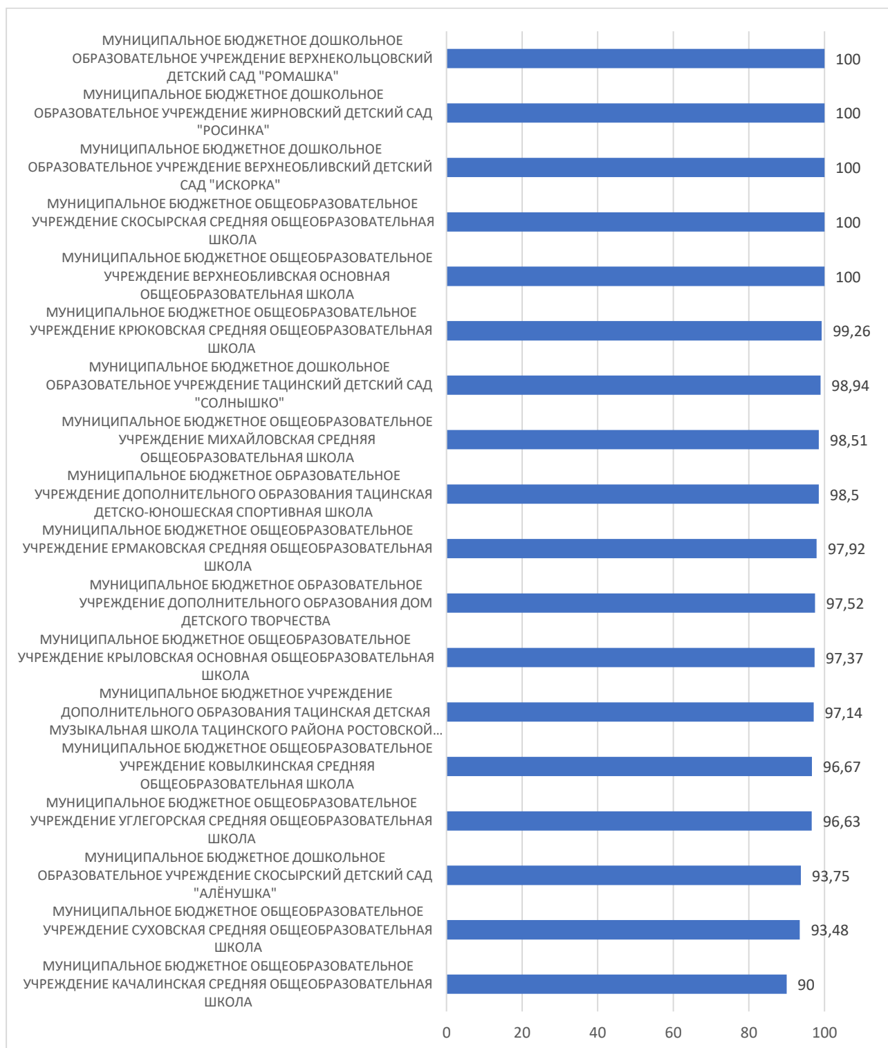
Рисунок 2 – Рейтинг организаций по критерию «Комфортность условий, в которых осуществляется образовательная деятельность»